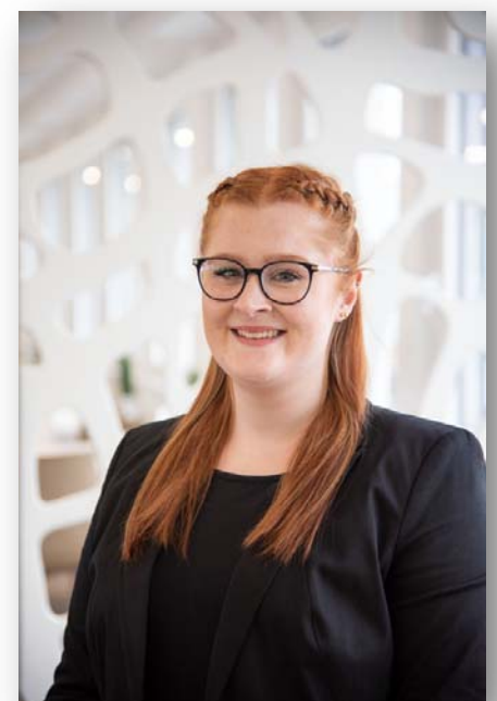
Foto: Nadine Zimmermann, Betriebswirtin (VWA) und Bachelor of Arts sowie Mitglied im Örtlichen Beirat der VWA Koblenz Quelle: Lohmann & Rauscher

Info und Anmeldung unter www.vwa-koblenz.de